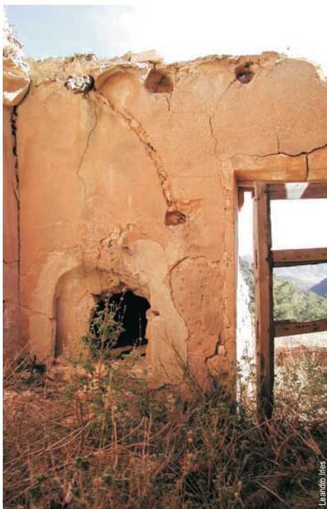
La Caseta, Cavafreda, Monóvar

entidad promotora: Ayuntamiento de Monóvar