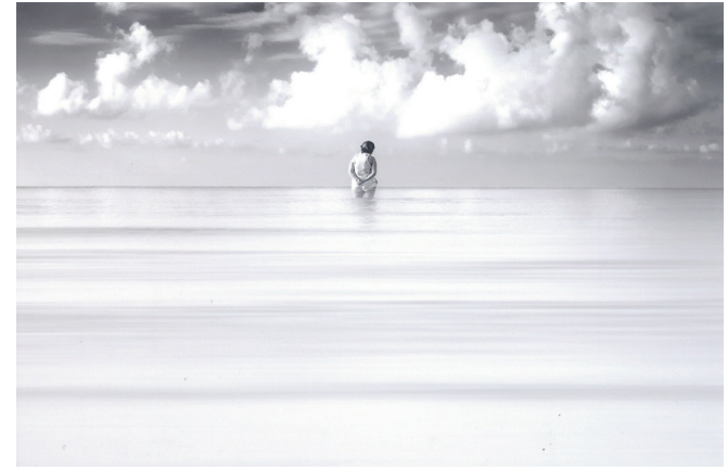
Mar en Calma | Autor: Sergio Juan Pérez 1º Premio Internacional del L Concurso Internacional de Fotografía