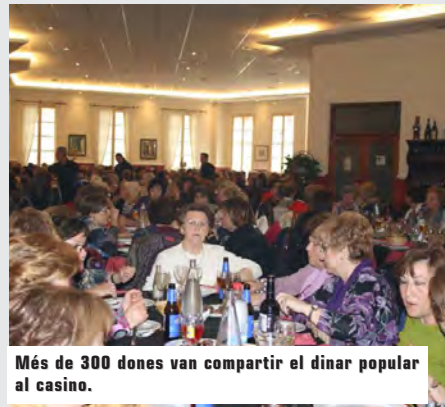
Més de 300 dones van compartir el dinar popular al casino.

A l'acte va participar l'Alcalde de la població, la Regidora de la Dona i el Regidor d'Educació junt a alumnes i a l'equip docent del centre. Els xics, per celebrar el Dia de la Dona Treballadora, van fer un mural en que apareixen les dones més importants de les seues vides.