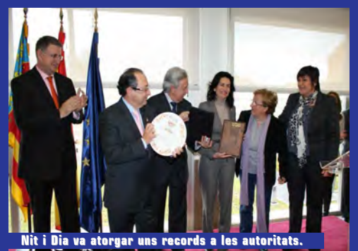
Nit i Dia va atorgar uns records a les autoritats.