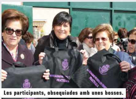
Les participants, obsequiades amb unes bosses.

Les activitats van començar al mig dia amb una concentració de les participants que es donaven cita en les instal·lacions del servei de rehabilitació de Les Moreres. Com tots els anys des de la Regidoria de la Dona es va fer entrega a totes les dones d'un detall consistent en unes bosses amb el lema de la campanya "La igualtat no està en crisi, practica-la".