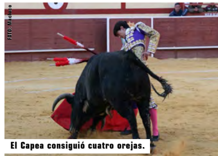
El Capea consiguió cuatro orejas.

Paquirri: En su primero, se lo volvieron a picar, por orden suya, hasta dejarlo sin ninguna fuerza e inválido, por lo que ni lo intentó, ni en banderillas, ni con la muleta, lo mató de aburrimiento al enésimo intento. A su segundo, de buen son, intentó sacarle sus condiciones y con la zurda sacó algún natural aceptable. Lo mató de pinchazo y media estocada y le otorgaron una oreja