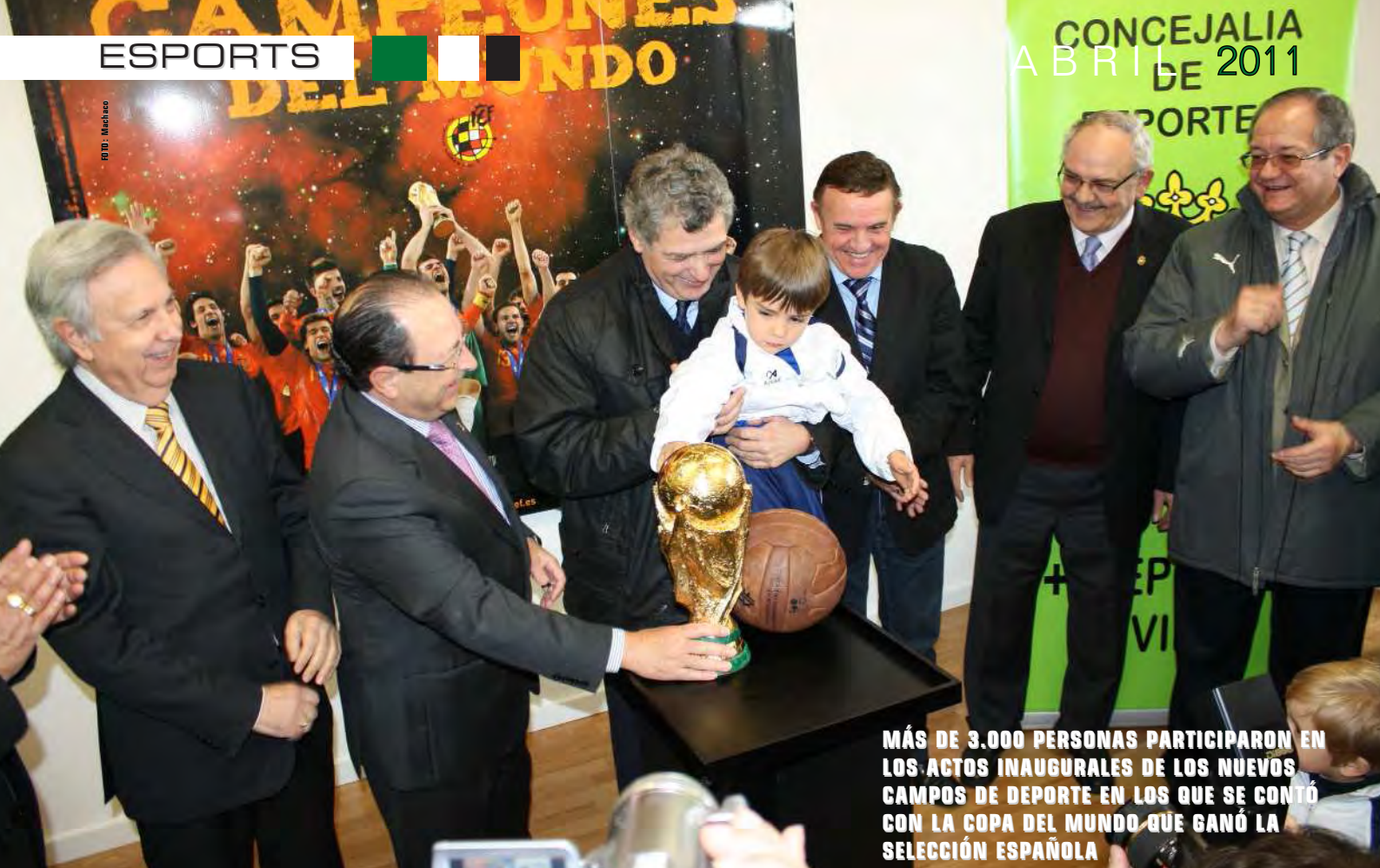
MÁS DE 3.000 PERSONAS PARTICIPARON EN LOS ACTOS INAUGURALES DE LOS NUEVOS CAMPOS DE DEPORTE EN LOS QUE SE CONTÓ CON LA COPA DEL MUNDO QUE GANÓ LA SELECCIÓN ESPAÑOLA