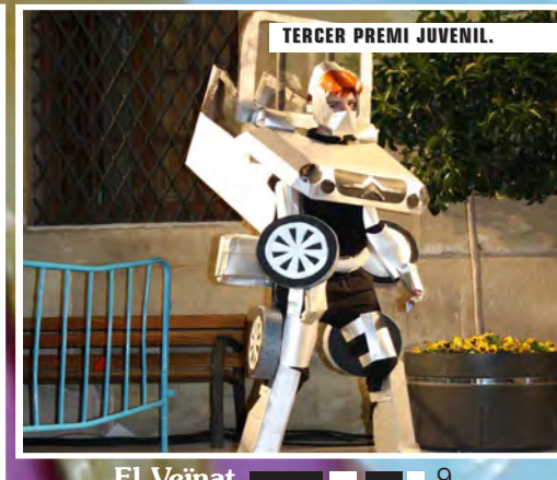
TERCER PREMI JUVENIL.