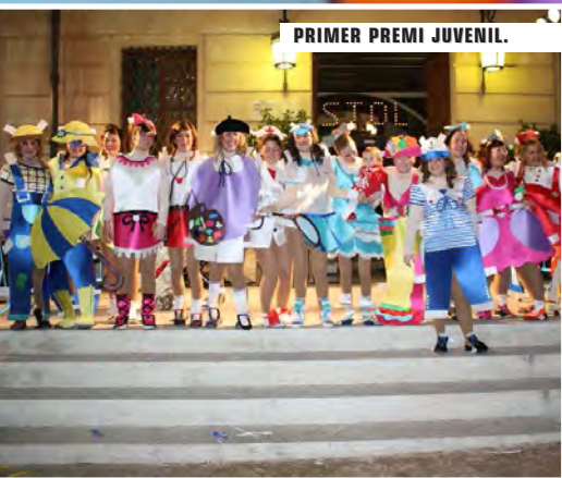
PRIMER PREMI JUVENIL.