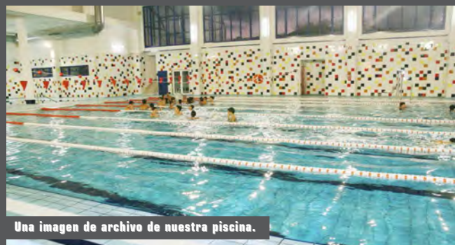
Una imagen de archivo de nuestra piscina.