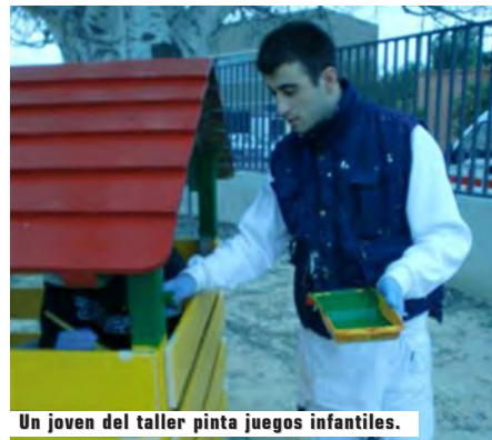
Un joven del taller pinta juegos infantiles.

Formación Orientación Laboral y Tutorial, encaminada a informar y formar respecto del marco legal de condiciones de trabajo, de relaciones laborales y de seguridad del ámbito profesional de que se trate, así como dotar al alumno de los recursos y de la orientación necesaria para la búsqueda de un puesto de trabajo y para el autoempleo.