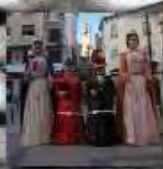
Exposición de la Asociación de Nanos i Gegants