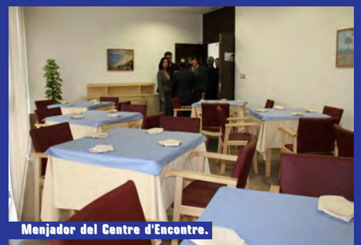
Menjador del Centre d'Encontre.

L'edifici té més de 2000 metres quadrats repartits entre les dos plantes i el soterrani, a més d'amplis espais verds. La lluminositat natural, la modernitat de les instal·lacions i l'amplària criden l'atenció d'aquest centre.