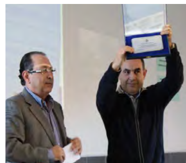
El director del IES muestra la placa por los buenos resultados en selectividad.

Se celebraron también charlas y mesas redondas en las que se abordaron las novedades en el sistema educativo y los posibles cambios previstos para el presente año, además de aportar orientación académica y profesional.