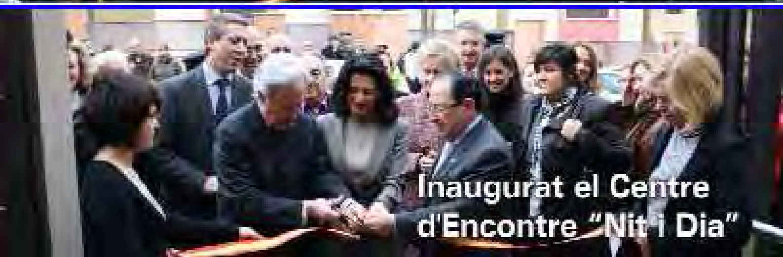
Inaugurat el Centre d'Encontre "Nit i Dia"