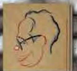
Pepe Amorós ... sus sueños