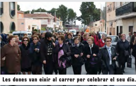
Les dones van eixir al carrer per celebrar el seu dia.

Tot seguit es va fer una marxa pels carrers que desembocava a la Casa de Cultura.