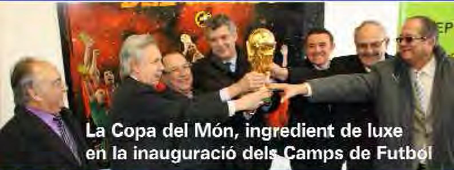
La Copa del Món, ingredient de luxe en la inauguració dels Camps de Futbol

ANY 32 - NÚM. 307 - EDIÇA: L'AJUNTAMENT DE MONÓVER - 1 D'ABRIL DE 2011 Versió digital en monover.es BUTLLETI D'INFORMACIÓ MUNICIPAL