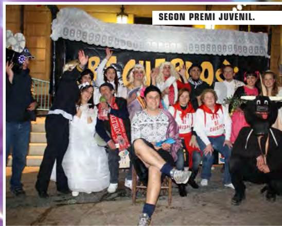
SEGON PREMI JUVENIL.