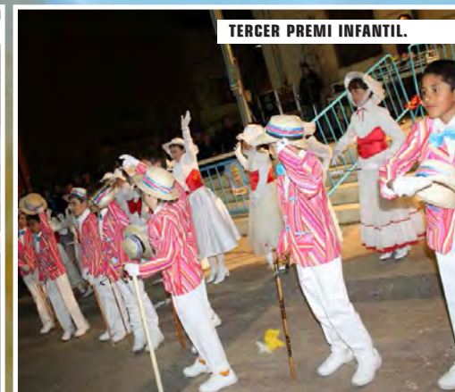
TERCER PREMI INFANTIL.