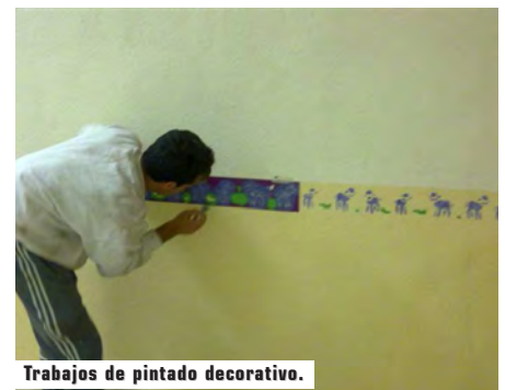
Trabajos de pintado decorativo.

En el Colegio Canyis: Masillado y pintado de Aulas, servicios, entrada y juegos infantiles del Parvulario. Pintura mural de la entrada del Colegio con Rosa de los Vientos, con los Puntos Cardinales y los nombres de los Vientos.