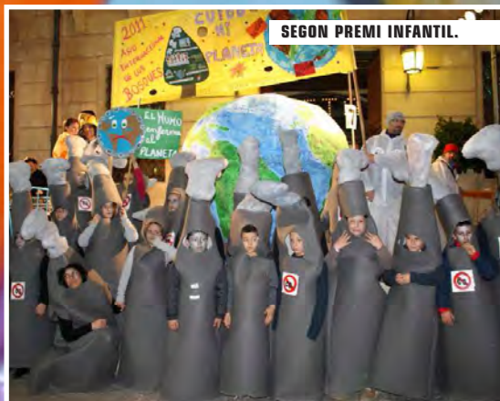
SEGON PREMI INFANTIL.