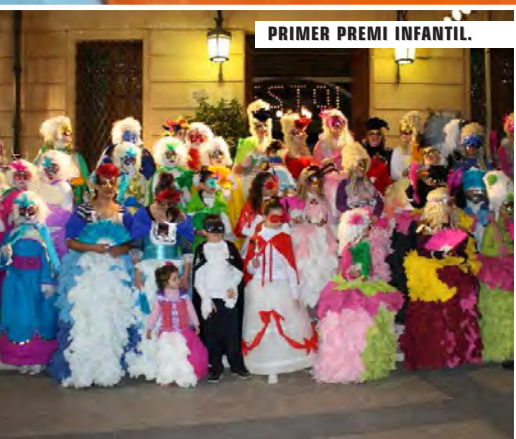
PRIMER PREMI INFANTIL.