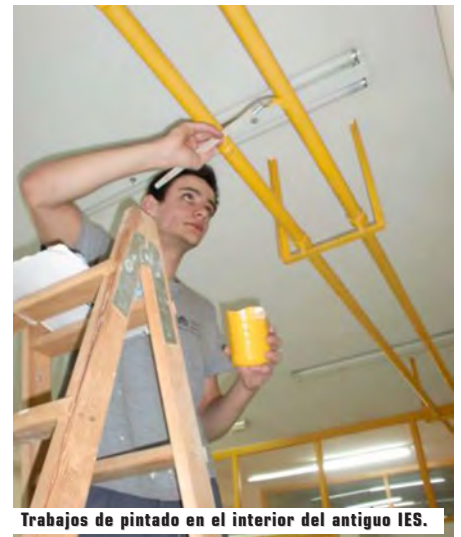
Trabajos de pintado en el interior del antiguo IES.

decorado con motivos infantiles y pintado de radiadores y tubos de calefacción de las aulas de la primera planta. Pintado de pintura pétreo lisa del muro perimetral. Rascado, pintado de minio y cambio de color de verde a esmalte azul de la cerca perimetral del antiguo Instituto e instalaciones de la Policía Local.