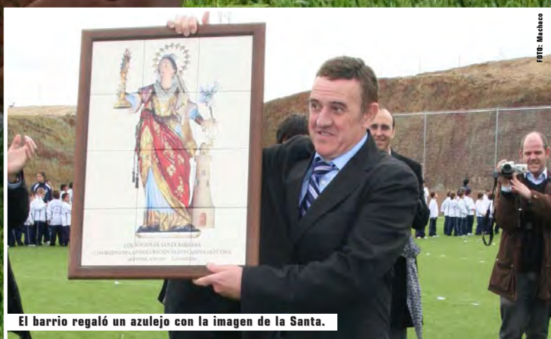
El barrio regaló un azulejo con la imagen de la Santa.