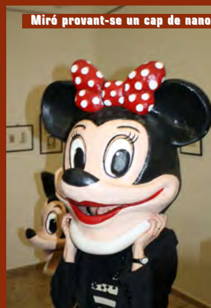
Miró provant-se un cap de nano.