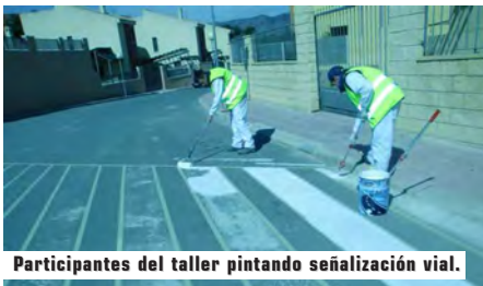
Participantes del taller pintando señalización vial.