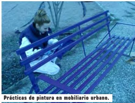
Prácticas de pintura en mobiliario urbano.

Los TFC son programas de formación-empleo que favorecen la contratación laboral de aquellos jóvenes entre los 16 y los 25 años que han abandonado la educación secundaria obligatoria sin titulación académica y/o profesional alguna que les posibilite su inserción en la vida laboral o continuar con otros estudios.