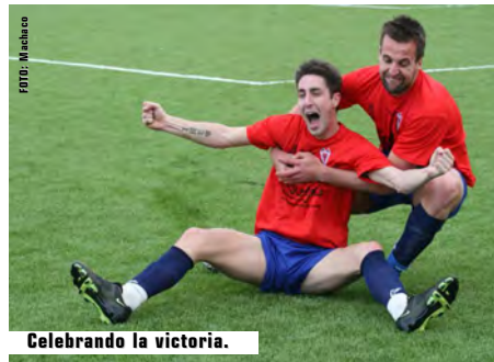
Celebrando la victoria.