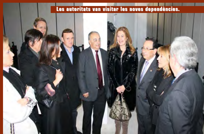
Les autoritats van visitar les noves dependències.