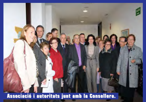
Associació i autoritats junt amb la Consellera.