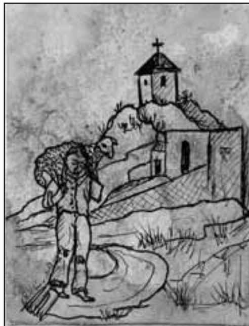
Il·lustració de Ramon Molina