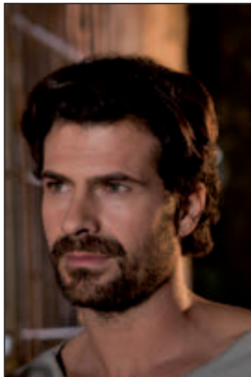
L'actor estarà a Monòver el dia 11.

Un canvi en les dates de rodatge van obligar a ajornar la visita que l'actor Rodolfo Sancho tenia programada a Monòver per a finals d'abril. Ara, la data elegida ha estat el pròxim 11 de maig, dia en què com estava previst amb anterioritat, participarà en el primerencontre de cine organitzat des de la Regidoria de Cultura.