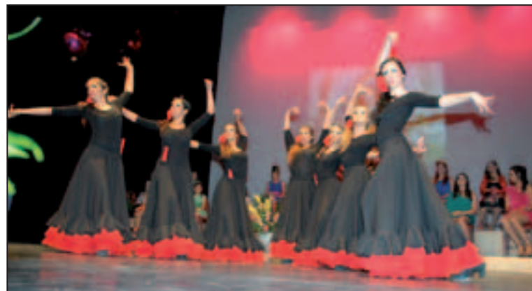
Les eleccions comptaran de nou amb actuacions en directe.

xiquetes que conformen les Corts d'Honor. Ambdós actes comptaran, a més, amb actuacions de ball que faran menys tensa l'espera fins que els membres del jurat comuniquen la seua decisió, moment culminant d'aquestes cites. El grup de ball de l'acadèmia Sara e Isabel actuarà en ambdós actes, si bé en el segon d'ells es comptarà també amb un grup de ball de l'acadèmia de Miriam Carrión. En el cas de l'elecció de setembre, l'única novetat respec-