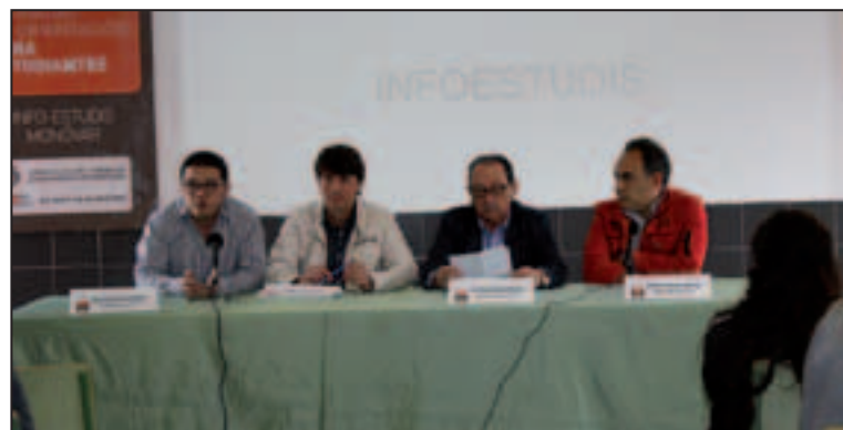
El director de l'IVAJ va assistir a la jornada inaugural d'Infoestudis.