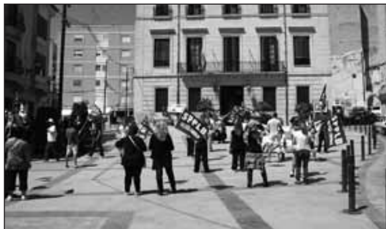
Familiares y compañeros de otras poblaciones se han sumado a las protestas.