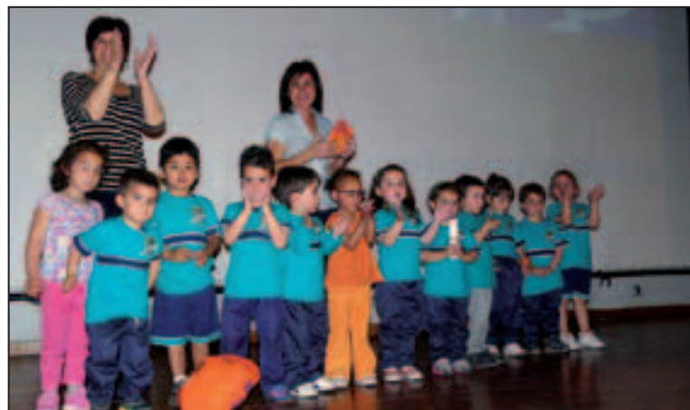
Un moment del lliurament de premis.