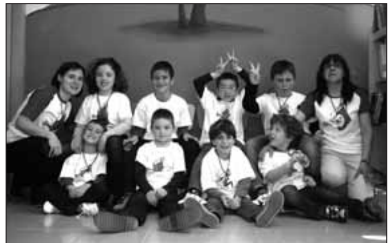
Participantes en una de las actividades promovidas desde la Biblioteca.

La convocatoria, una vez más, iba dirigida a la promoción de la lectura en bibliotecas municipales de poblaciones de menos de 50.000 habitantes, entre las cuales se ha considerado merecedora de uno de estos premios a la biblioteca monovera que sigue con una intensa actividad en