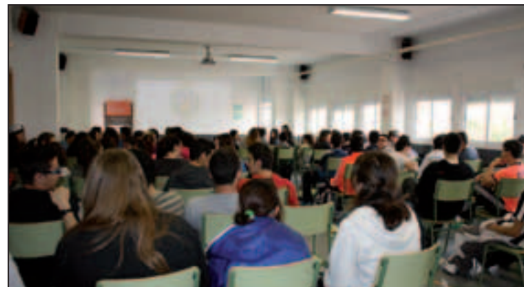
Els alumnes van seguir amb atenció les xarrades incloses dins d'aquesta jornada.