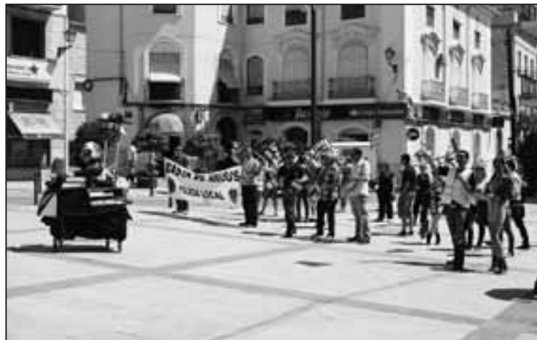
Las concentraciones en la Plaza de la Sala se han repetido todos los jueves.

Desde la alcaldía, Salvador Poveda insiste en recalcar que “la retirada de la productividad