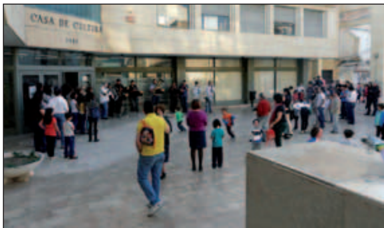
Rebuda dels assistents a l'exterior de la Casa de Cultura.

El 28 d'abril estava previst que es portara a terme la Trobada d'Escoles en Valencià de les Valls del Vinalopó al parc de l'albereda però, la pluja va obligar a ajornar uns dies aquesta cita. El que no va patir cap modificació va ser l'acte de presentació que va reunir un bon grapat de xiquets a l'auditori de la Casa de Cultura.