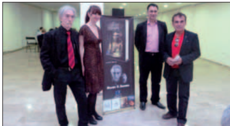
El regidor de Cultura amb els ponents en la presentació de La reina imposible .

Emma Caballero i Nereida Carrillo van presentar els llibres La reina imposible i Momentos poco estelares de la humanidad , dues lectures recomanades des de la Biblioteca Pública.