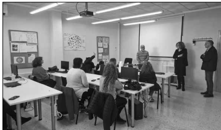
Persones que participen actualment en el Taller d'Ocupació "Monòver VII".

Aquest projecte compta amb un pressupost de 251.354,40 euros, subvencionat per la Direcció General d'Ocupació i Formació.