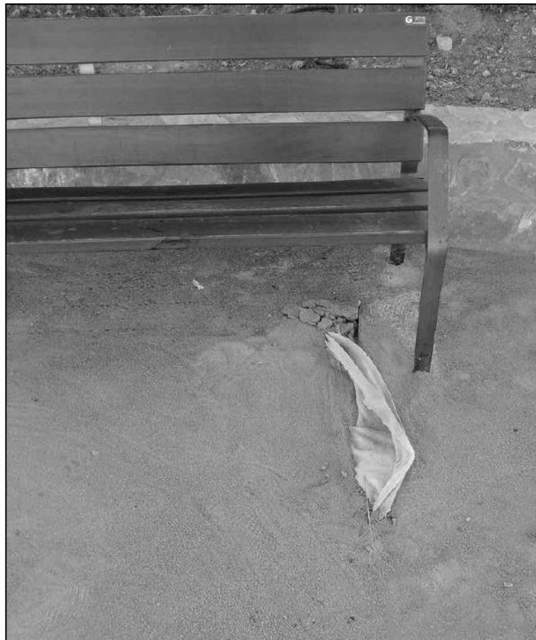
Parc ubicat al carrer Sant Francesc, al barri de Santa Bàrbara.

Així, l'article 18 indica que "embrutar les vies públiques i qualsevol espai destinat al trànsit o a l'esbarjo del ciutadà, com ara parcs, jardins, o espais com el Camp de Marín, etc. amb deposicions fecals de gossos tenen una multa de 50 euros".