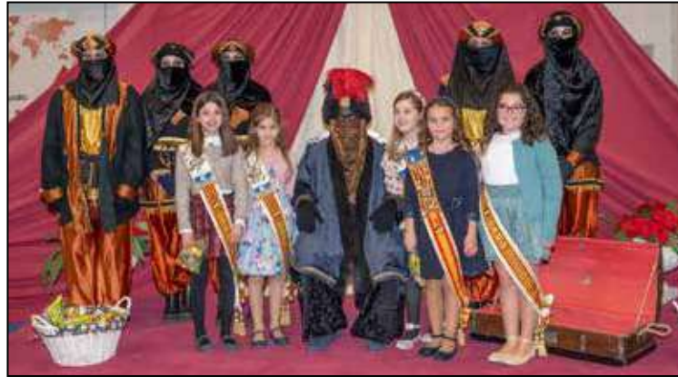
La Cort d'Honor 2022 amb l'Herald Reial - Foto: Salva Palazón.

El cinema en valencià, contes de Nadal en família, la primera edició de l'Escola Nadalenc, amb animacions, tallers i festa de Cap d'Any, o el concert d'orgue i dolçaina del Grup Ternari, van destacar dins el programa cultural de desembre. Però sens dubte, l'arribada a la localitat de l'Herald Reial va resultar ser un moment molt especial per als més petits de la ciutat. Com ja es va fer en anys anteriors, es va tornar a triar el Pavelló Esportiu Municipal número 2 com a ubicació d'aquesta visita, la qual va coincidir amb una nova edició de la Fireta de