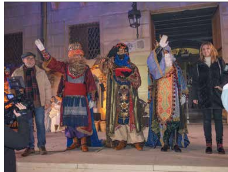
Cavalcada dels Reis Mags 2023