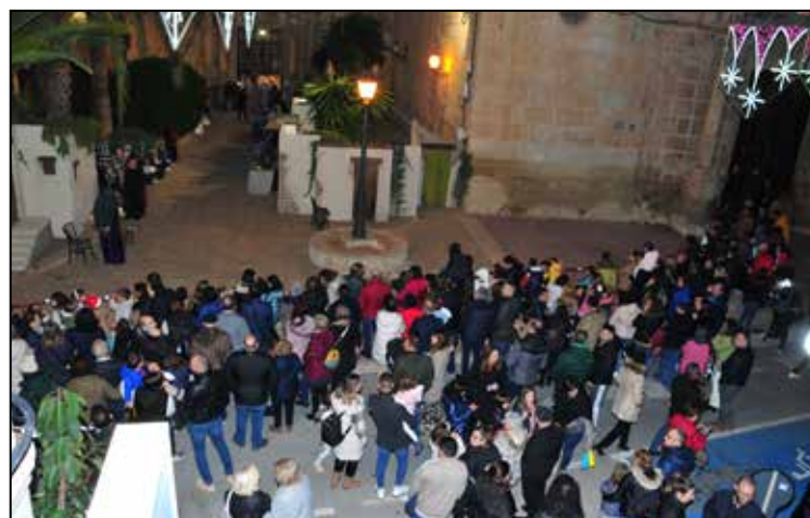
Celebració del Betlem Vivent

Nadal, que també es trobava a l'interior del Pavelló Esportiu Municipal.