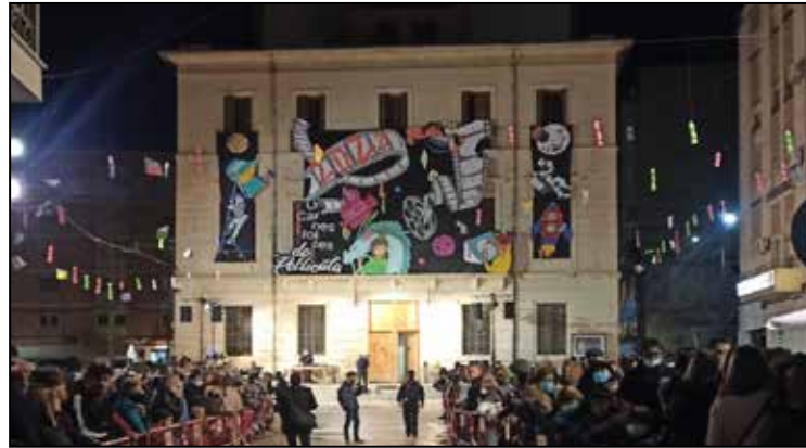
Imatge de la Plaça de la Sala en el Carnestoltes de 2022.

Pel que fa als premis d'aquesta edició seran els següents: En la Categoria Infantil: AMPES: cada AMPA participant tindrà una aportació per participació de