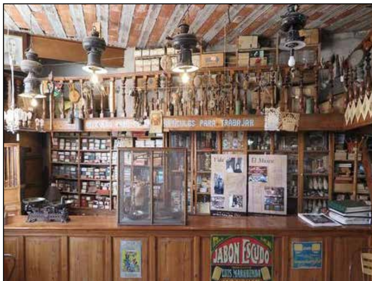
Museu d'Arts i Oficis de Monòver.

Així mateix, també hem rebut visites d'associacions, universi-