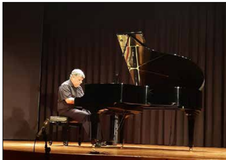
Imatge d'arxiu d'anteriors Cicles de Concerts dutts a terme a Monòver.

Concerts que es duran a terme divendres o diumenges fins a maig de la mà de l'alumnat de Grau Superior del Conservatori.