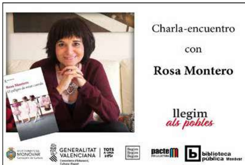
Cartell anunciador de la Xarrada-Encontre amb Rosa Montero.

L'escriptora Rosa Montero visitarà Monòver el pròxim 9 de febrer en un acte organitzat per la Biblioteca Pública de Monòver, en el qual els assistents podran gaudir d'una xarrada-encontre amb l'escriptora a l'Auditori Antonio J. Ballester de Casa de Cultura de Monòver a partir de les 20:00 hores.