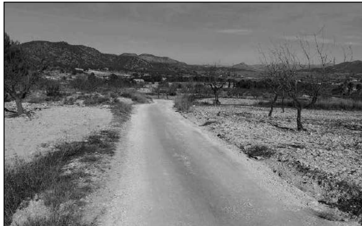
Mejoras en caminos del Hondón, las Casas del Señor y el Xinorlet e instalación de bancos en la Plaza de la Sala.

La Concejalía de Agricultura del Ayuntamiento de Monóvar continúa invirtiendo en la mejora de los caminos del término municipal. Diversas han sido las carreteras y caminos de tierra que se han adecuado en las últimas semanas. En concreto, durante diciembre se ha procedido a mejorar el camino del Hondón-Cañada Roja, donde se ha asfaltado por completo el tramo, que corresponde a 600 metros de camino, "una actuación muy demandada por la ciudadanía".