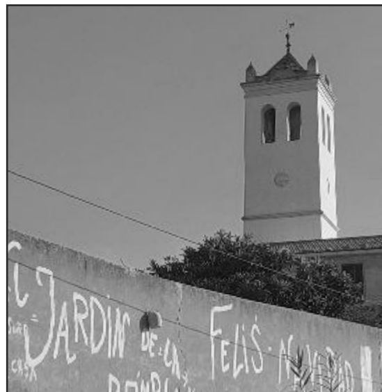
Fotografia i dedicatòria: Andrea

El pròxim número d'El Veïnat estarà al carrer al mes de febrer. Si voleu col·laborar-hi recordeu que haureu d'entregar els vostres escrits com més prompte millor a la següent adreça: ana@laestacioncreativa.com