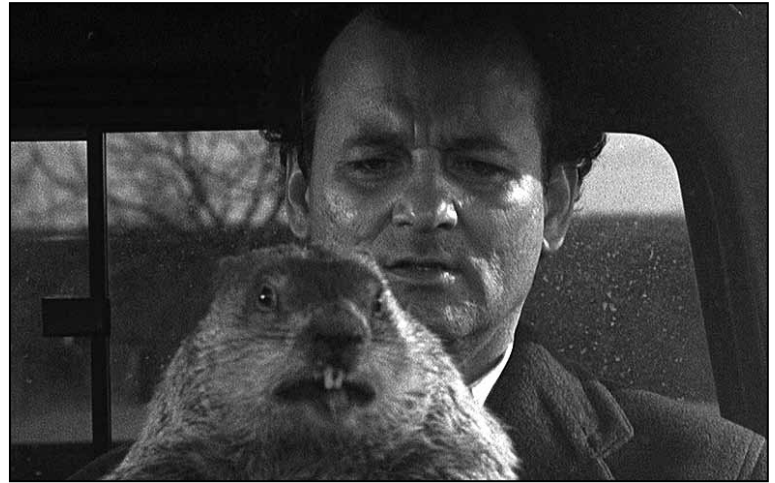
Escena de la película "Atrapado en el tiempo".

Cuando el mundo exterior está enviando vibraciones negativas, cuando has pasado momentos desesperados pensando que el "covid 19" estaba dentro de tu casa; porque al principio de la epidemia habías estado en el hospital y no habías tenido ninguna precaución; habías tocado todos los botones del ascensor, no te habías limpiado la ropa, ni los zapatos, ni llevabas mascarilla, ni guantes; cuando los que viven contigo tienen unas décimas de fiebre o tosen y el corazón te late a mil por hora y las noches son una sucesión de pesadillas en las que todos estamos enfermos..., después de esta experiencia traumática..., ¿cómo