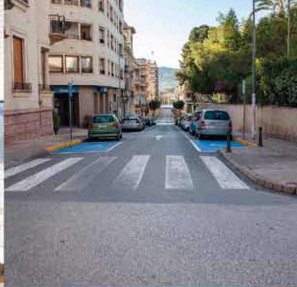
Imatges de Monòver confinat. Pepe Giner.