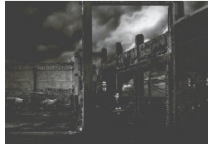
De otros tiempos 2 | Autor: Diego Pedra Benzal 1º Premio Internacional del LII Concurso Internacional de Fotografía